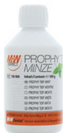
M+W Propy prah za piskarenje 300 g *100888, menta *100887, lemon