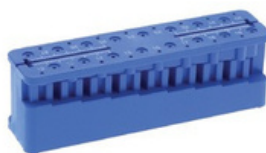
M+W Endoblok mjerka *400680, plavi