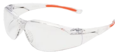
M+W select zaštitne naočale Basic *100069