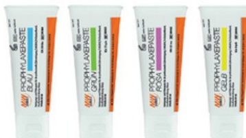
M+W Prophypasta za poliranje 13,20 €

*200862, roza RDA120 *200861, zelena RDA170 *200860, plava RDA250 *200863, žuta RDA40